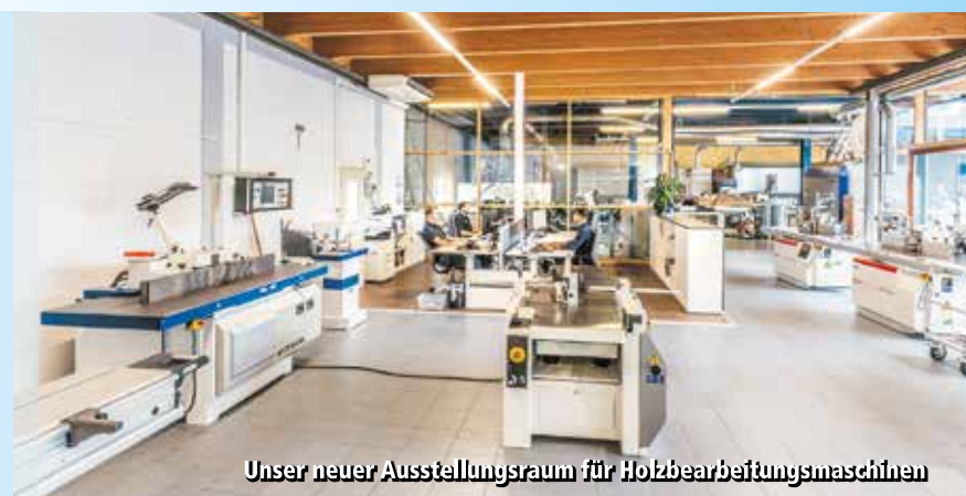
Unser neuer Ausstellungsraum für Holzbearbeitungsmaschinen