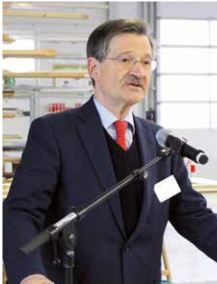
Dr. Hermann Otto Solms ermutigte dazu, die Arbeit der GroKo kritisch zu begleiten.

Mit Blick auf den Koalitionsvertrag verdeutlichte er, „dass es keine Fortschritte für die Wirtschaft“ gebe. Es sei ein „Weiter so“ wie bisher und die Vereinbarung der Koalitionäre perspektivlos. Der demografische Wandel, die Globalisierung und weniger Facharbeiter fordern die Wirtschaft jetzt und zukünftig heraus. „Wir müssen flexibler und effizienter werden und uns den Herausforderungen stellen“, so Solms. Darauf muss sich die Wirtschaft vorbereiten. Für die verdoppelten Steuereinnahmen der letzten Jahre forderte er, dass denen etwas gelassen wird, die diese Steigerung erwirtschaftet haben. Doch „steuerlich ist nichts drin“. Es ist deshalb geboten, die Vorhaben der Großen Koalition kritisch zu begleiten.