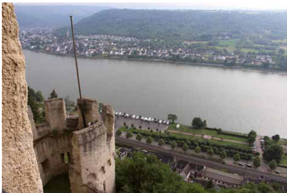
Getreu nach dem Motto „Brot und Spiele“ besichtigten die Delegierten am Vortag die Marksburg in Braubach.

Eingehend auf den aktuellen „DSGVO-Hype“ erläuterte Hubing die zahlreichen Angebote des Verbandes an die Mitgliedsunternehmen, die nur sehr spärlich wahrgenommen wurden. Viele Kollegen hätten offenkundig noch nicht realisiert, dass partiell durchaus eine Bedrohung