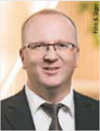
Ralf Gutheil Bürgermeister der Stadt Bad Wildungen