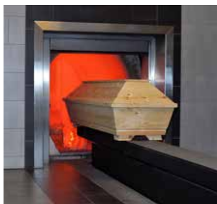
Das Rhein-Taunus-Krematorium schafft bis zu 160 Einäscherungen am Tag.

um rund 20 Prozent gestiegen. An der Belastungsgrenze sieht er sich und seine Kollegen aber nicht. „Wie viele andere Krematorien in Deutschland, so sind auch wir in der Lage, alle Einäscherungen zeitnah vorzunehmen“, so Könsgen. Allerdings investiere man auch regelmäßig in die Wartung und Pflege der Einäscherungsanlagen, habe flexible Arbeitszeiten und in immer mehr Bereichen werde papierlos gearbeitet. Zudem funktioniere die Zusammenarbeit mit den lokalen Behörden - beispielsweise bei der gesetzlich vorgeschriebenen zweiten Leichenschau - sehr gut.