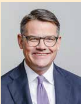
Hessischer Ministerpräsident Boris Rhein

Menschen nach ihrem Tod würdig beizusetzen ist eine Aufgabe, die Kompetenz und Einfühlungsvermögen verlangt. Denn es geht nicht nur um die Toten selbst, sondern auch um diejenigen, die um die Verstorbenen trauern. Die Unternehmen, die diese Leistungen